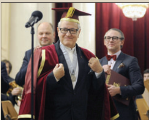
Вручение диплома и мантии почетного профессора Давиду Герингасу

На открытии фестиваля в Большом зале филармонии студенческими оркестром и хором под управлением Василия Синайского были исполнены Месса Сраш или «короткая месса» До-мажор Моцарта, Первая симфония и Первый виолончельный концерт Шостаковича, где солистом выступил Давид Герингас. Ему были вручены диплом и мантия Почетного профессора Санкт-Петербургской консерватории.