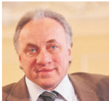
Михаил Гантварг, народный артист России