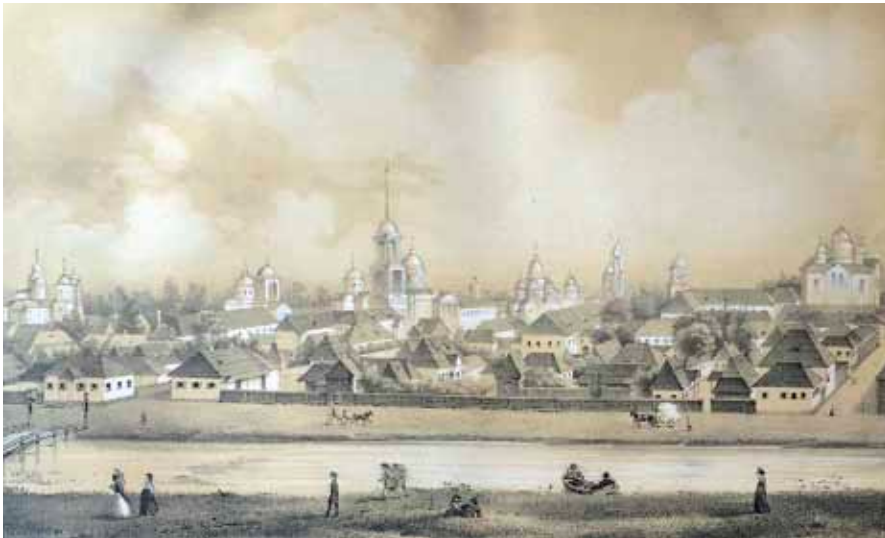
Ил. 1. Нежин. Иллюстрация из кн: Лицей князя Безбородко. СПб., 1859