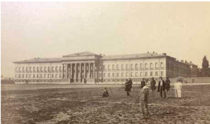
Ил. 2. Киевский университет Святого Владимира.