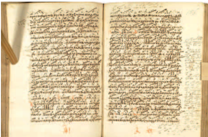
Ил. 1. Дополнительные распевы на полях рукописи

ных начертаний и фитных разводов. Их, как отмечалось, очень много, тем более что в рукопись включены песнопения Стихираря минейного с Двенадесятыми праздниками, где фитное пение традиционно играет особенно большую роль. Вот фрагмент рукописи, демонстрирующий работу автора: здесь на полях листа выписаны многочисленные распевы (ил. 1)