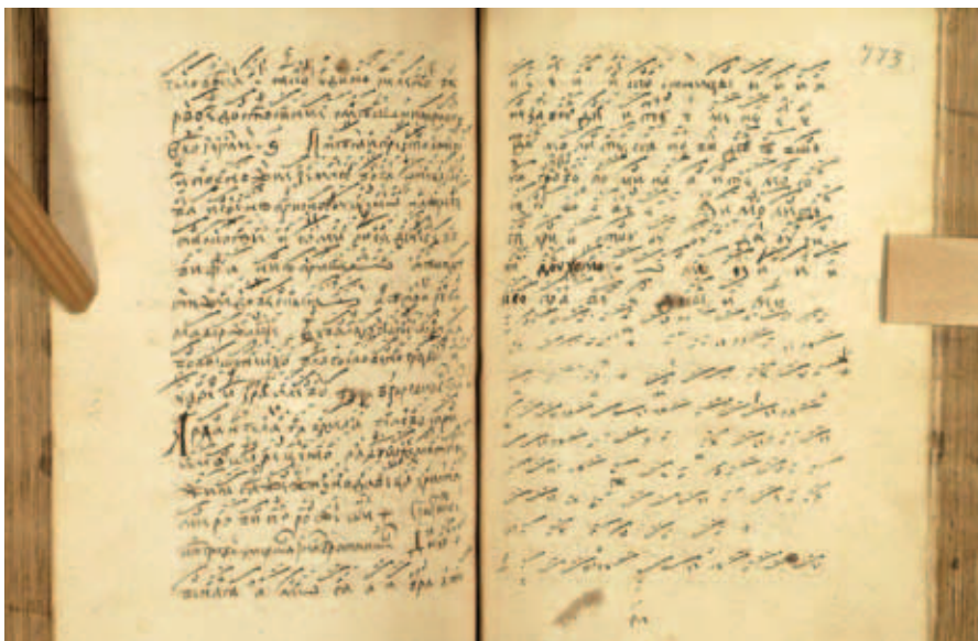
Ил. 4. Фитные разводы без подтекстовки

После знаменного песнопения «Духовенная моя братия», которому предшествует группа путных славников из двенадцатых праздников, возникает минифитник со знаменными разводами практически без подтекстовки, где под нотными строками в основном стоят только отдельные буквы (л. 773), не позволяющие точно атрибутировать строки (ил. 4).