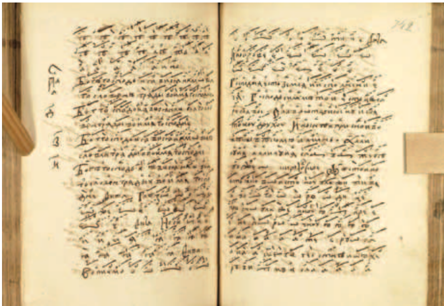
Ил. 3. Фитные разводы с ремарками «фита» в справочных разделах

Введение минифитников вне конкретной службы, но в рамках каких-то справочных разделов. Например, на лл. 741 об.–742 после подборки «Бог Господь» идут выписанные теми же чернилами четыре путных фитных развода, каждый из которых сопровождается указанием «фита» 11 (ил. 3).