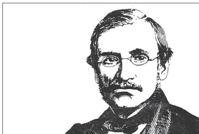
Портрет О. Кольберга (1840 г.) — символ мероприятий Года

6 декабря 2013 года Сейм Республики Польша в ответ на заявление министра культуры и национального наследия Богдана Здроевского принял резолюцию о признании 2014 года Годом Оскара Кольберга. Ответ-