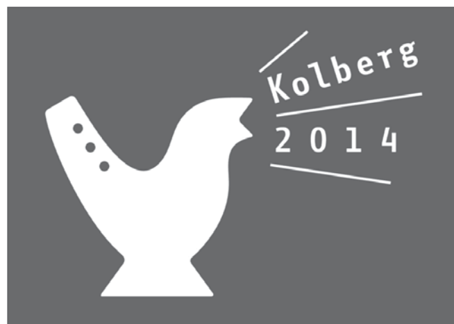
Логотип Года Кольберга

22.02 — открытие выставки «Поблагодарите Оскара Кольберга за его тяжкий труд. Оскар Кольберг: этнограф, музык [ант] (ограф), шопенолог» (Варшава, Музей Фридерика Шопена (дворец Глинских);