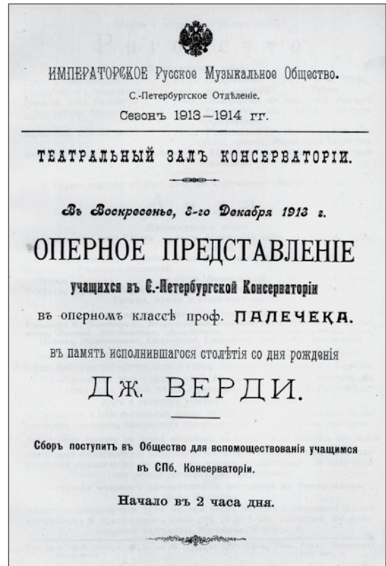
Афиша оперного представления, посвященного 100-летию юбилею Дж. Верди и состоявшегося в Консерватории 8 декабря 1913 года. Печатный экземпляр. НМБ СПбГК

никами Отдела иностранной литературы НМБ «Musicus legens. Автографы и экслибрисы в книгах педагогов и выпускников Санкт-Петербургской консерватории» 2 .