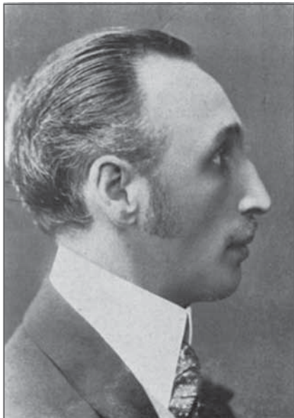
Николай фон Струве, фотография, подаренная Роберту Штерлю

Имя Николая Густавовича фон Струве недостаточно хорошо известно широкому кругу музыкантов — разве только в связи с деятельностью Российского музыкального издательства. Тем не менее, этот человек, композитор, в начале XX века был значимой персоной в музыкальных кругах.