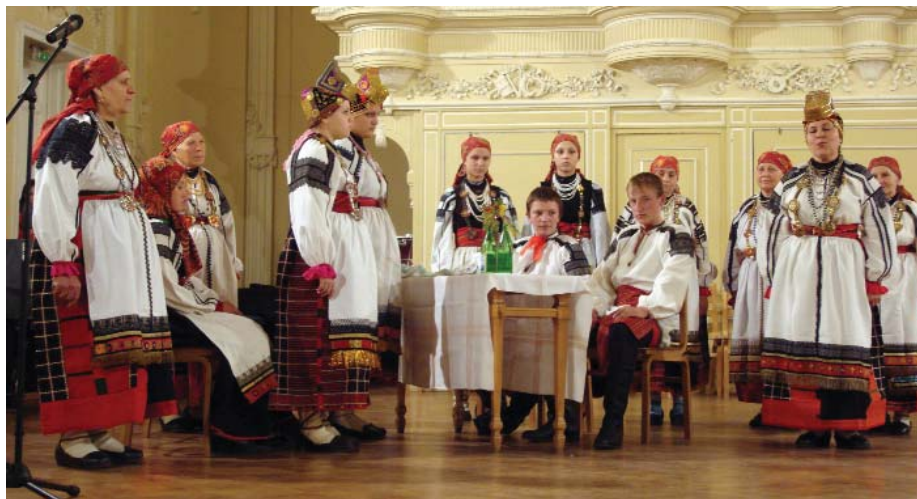
Ансамбль народных исполнителей и детский фольклорный ансамбль «Чернозёмочка» с. Нижняя Покровка Красногвардейского района Белгородской области на концерте в Малом зале имени А. К. Глазунова