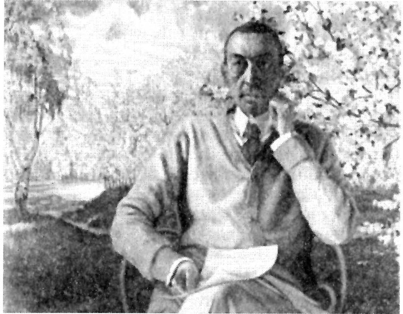
С.В. Рахманинов. Портрет работы К. А. Сомова (Корбевиль, 1925)

В конце 1923 года в Нью-Йорк была отправлена выставка произведений русского искусства. Сопровождать эту выставку вместе с другими художниками поехал и Сомов. В Россию ему не суждено было вернуться. Неоднократно он гостил в семье С.В. Рахманинова. В 1925 году художником были написаны портреты великого музыканта и его дочери. Картины находятся в коллекции семьи Рахманиновых в Нью-Йорке. По воспоминаниям Сомова, когда