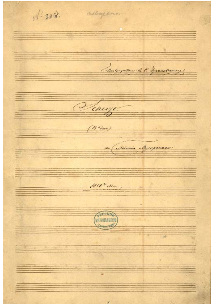
Фото. 2. Мусоргский М. П. Скерцо В dur. Титульный лист со штампом РМО. Автограф. НИОР СПбГК. № 1756

Некоторые важные сведения, косвенным образом дополняющие тему исполнения сочинений Мусоргского в концертах РМО и Консерватории, представляют фонды библиотеки. Ее формирование осуществлялось за счет приобретений и даров. Благодаря активной концертной деятельности РМО рукописи исполненных произведений, как правило, оставались в библиотеке Общества. Таким же образом в ней оказались и манускрипты произведений Мусоргского. Вероятно, РМО вообще стало первым официальным учреждением, в котором стали храниться автографы композитора. Так, например, еще с 1860 года в библиотеке РМО находились следующие его подлинные рукописи: партитура Scherzo B-dur , исполненного Рубинштейном (фото 2), клавиры и партитура хора второй редакцией из музыки к трагедии «Эдип», предназначенного для одного из концертов РМО 8 . Некоторое время в библиотеке хранился и автограф марша «Взятие Карса». В 1881 году по просьбе С. Н. Кругликова Римский-Корсаков, с разрешения Мусоргского, отправил рукопись марша в Москву для переписки в связи с его исполнением в концерте Общества П. А. Шостаков-