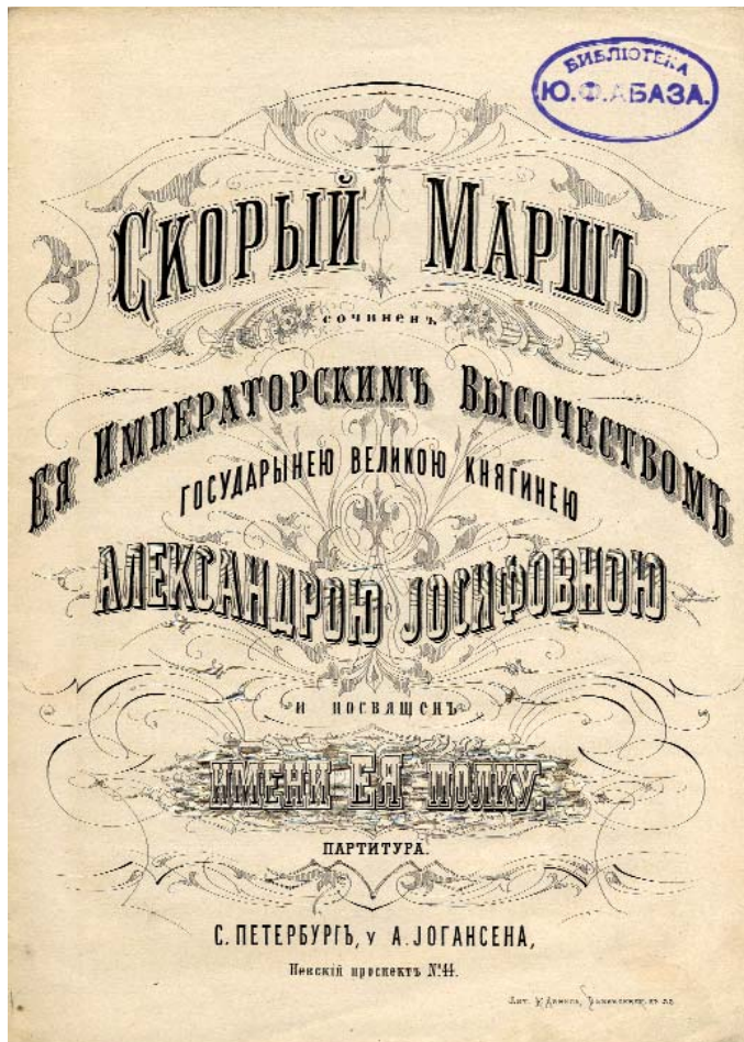
Фото 4. Вел. кн. Александра Иосифовна. Скорый марш. Титульный лист. Отдел нотных изданий НМБ СПбГК