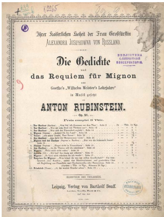
Фото 2. Рубинштейн А. Г. Стихи и Реквием по Миньоне. Титульный лист первого издания с посвящением Александре Иосифовне. Отдел нотных изданий НМБ СПбГК