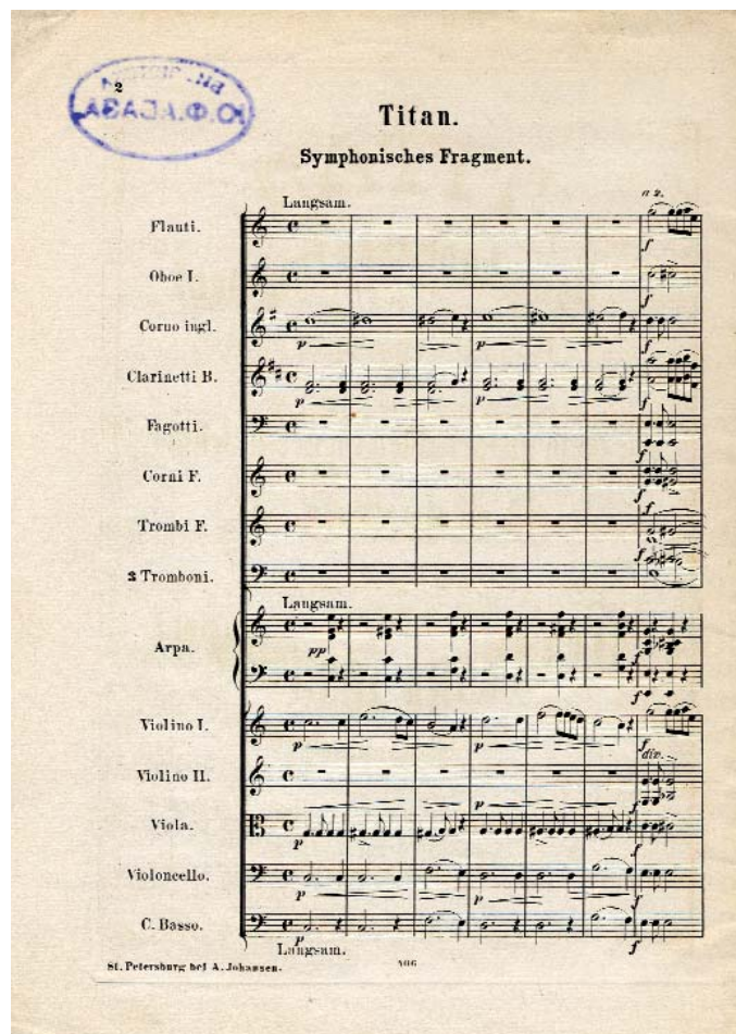
Фото 3. Вел. кн. Александра Иосифовна. «Титан». Титульный лист, 1-я страница партитуры. Отдел нотных изданий НМБ СПбГК

ческих: «Псалом» и «Кантата» 7 . Примечательно, что на экземплярах всех пяти изданий стоит штамп «Библиотека Ю. Ф. Абаза», свидетельствующий о принадлежности их Юлии Фёдоровне Абаза (ум. 1915), известной певице-любительнице.