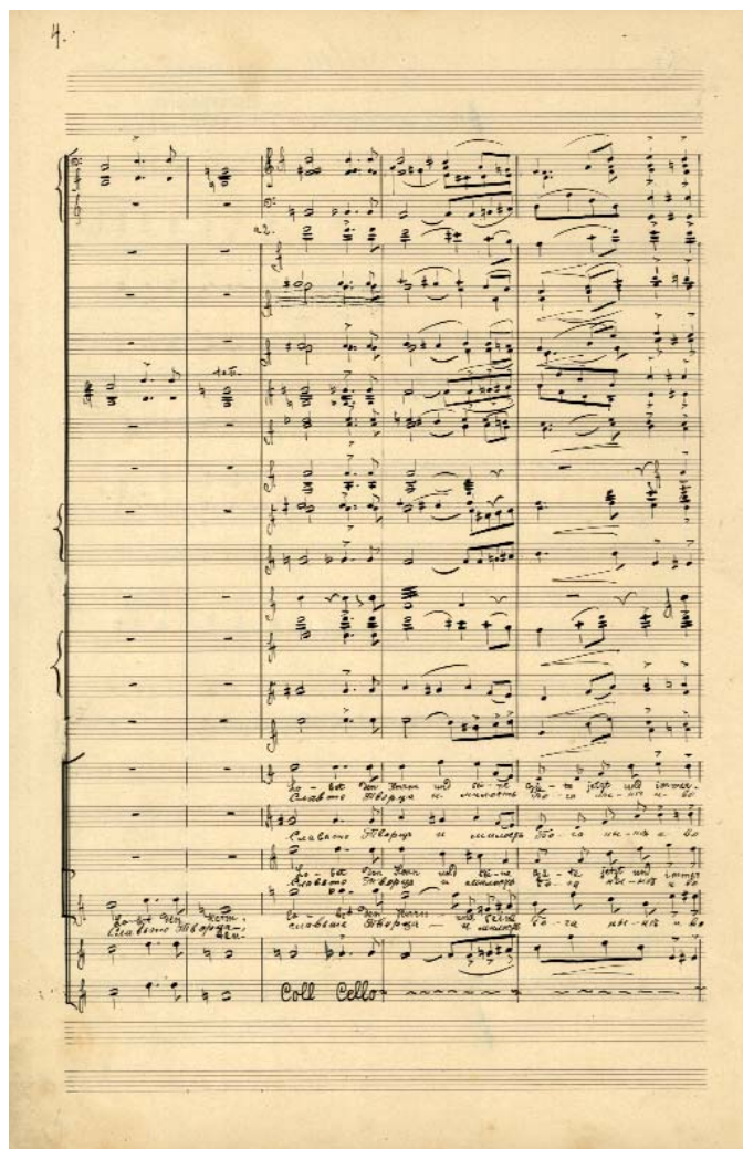
Фото 7. Вел. кн. Александра Иосифовна. Псалом. Страница рукописной партитуры. НИОР НМБ СПбГК. Инв. 4361