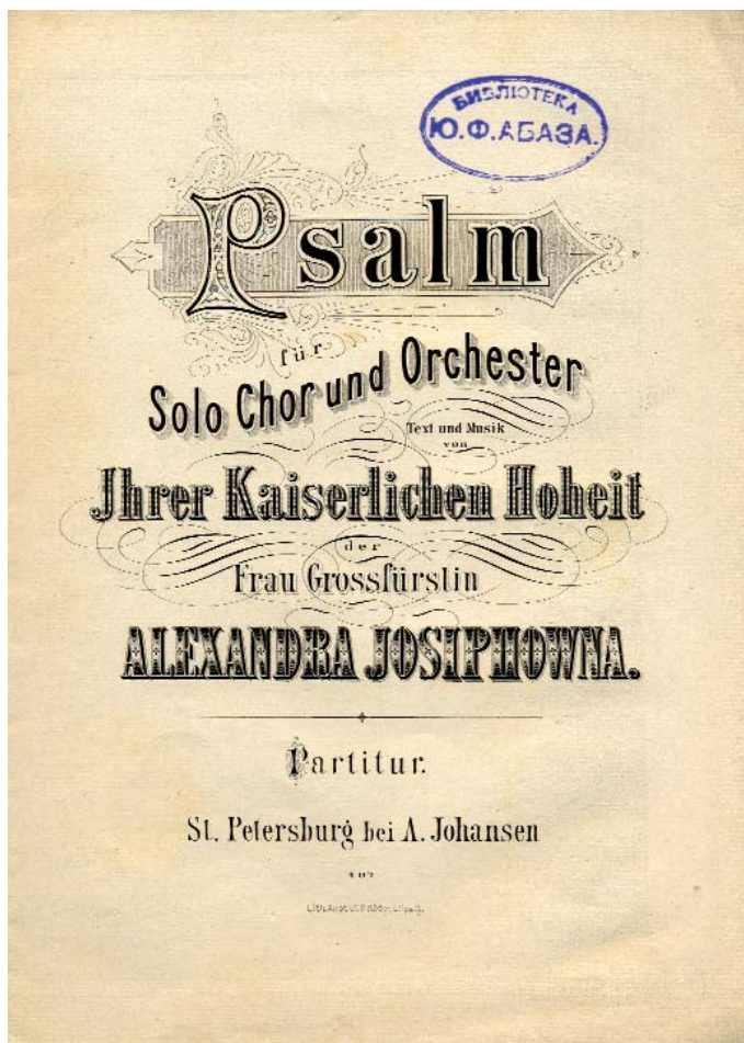
Фото 6. Вел. кн. Александра Иосифовна. Псалом. Титульный лист. Отдел нотных изданий НМБ СПбГК