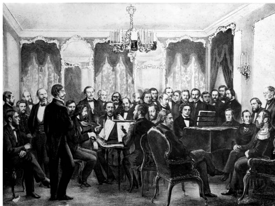
Музыкальные вечера А. Г. Рубинштейна. Литография Мюнстера (по рис. Лебедева 1860 года). Музей истории СПбГК

Думается, что к будущему очерку о жизни и деятельности самого П. Л. Кона можно было бы поставить в качестве эпиграфа его собственные слова: «Я был учеником Рубинштейна, слышал его неоднократно, знаю его творения, как никто другой во всем мире» 4 .