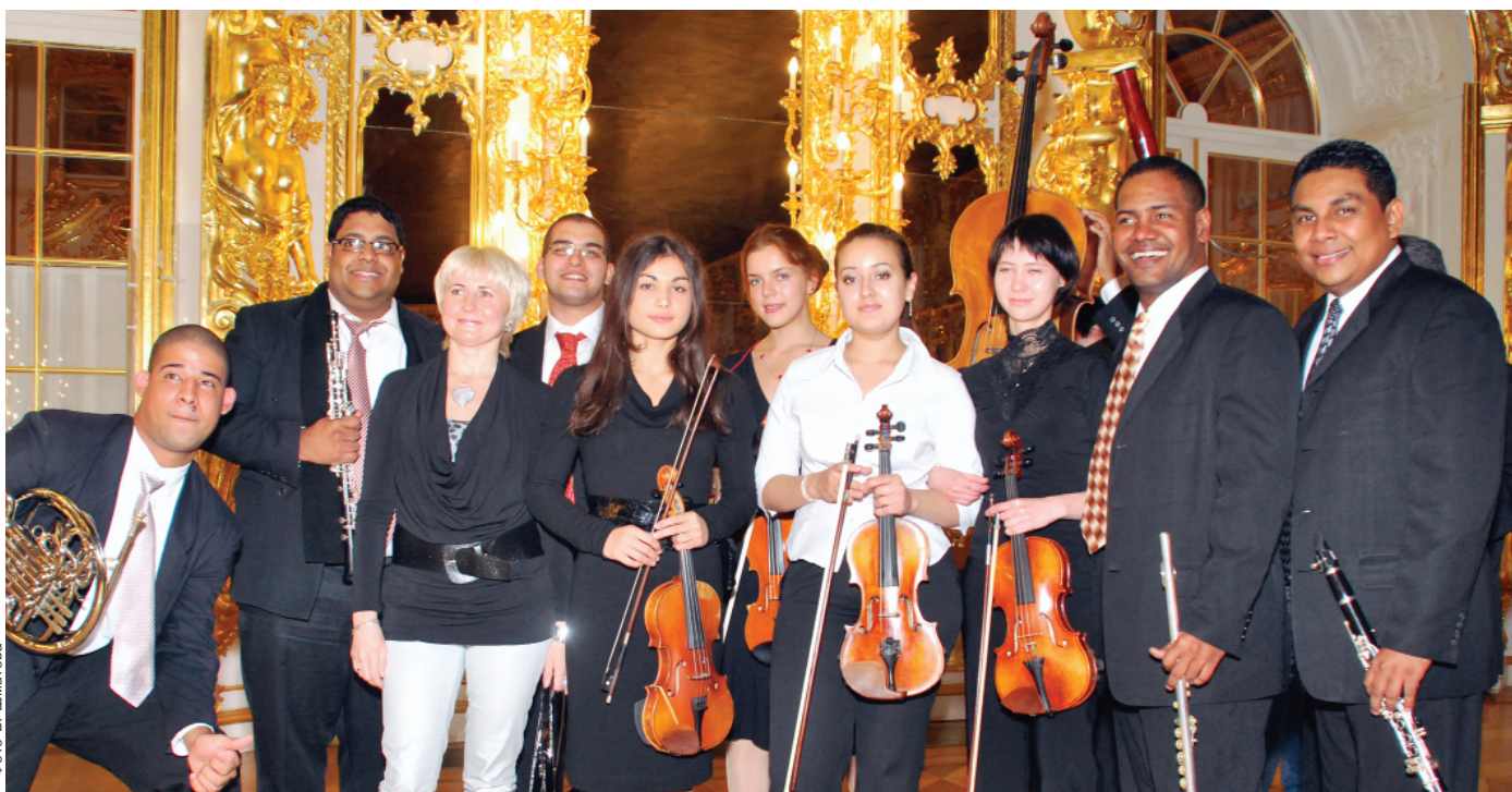
Инструментальный ансамбль «Vivace» (Панама) — Большой зал Екатерининского дворца (г. Пушкин)

В концерте 22 октября «Музыкальные путешествия» выступали музыканты из консерваторий и академий Чили, Аргентины, Гватемалы